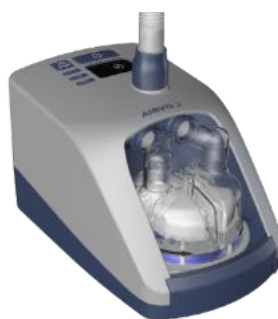
Airvo 2 / myAirvo 2