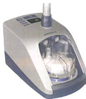
Airvo 2 / myAirvo 2