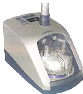
Airvo 2 / myAirvo 2