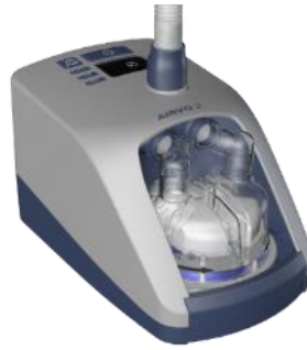
myAirvo 2 / Airvo 2