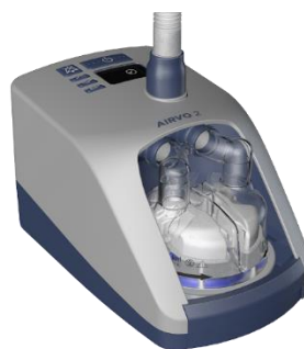
Airvo 2 / myAirvo 2