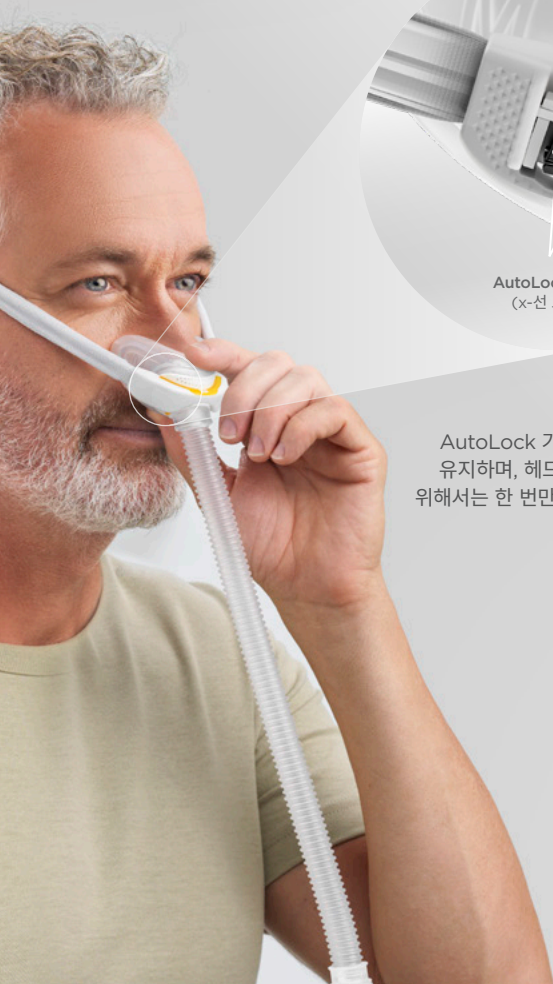
AutoLock™ 기술 (x-선 보기)

AutoLock 기술은 밀착을 유지하며, 헤드기어를 풀기 위해서는 한 번만 당기면 됩니다.