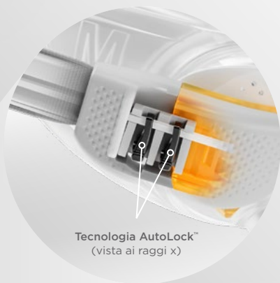
Tecnologia AutoLock™ (vista ai raggi x)

La tecnologia AutoLock mantiene la maschera in posizione ed è sufficiente tirarla delicatamente per allentare la fascia nucale.