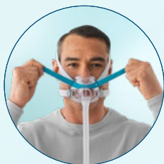
Regolare la cinghia superiore