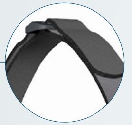
Arnés ErgoFit Tiras de velcro integradas Ganchos Correa de la coronilla ajustable