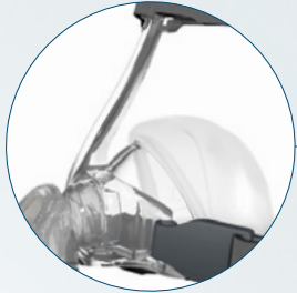
Easy Frame (leichter Rahmen) Mit Q-Abdeckung